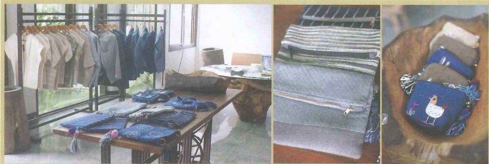
自然光の入るギャラリーでじっくり工芸品を見ることができる。 織り模様美しいポシェット お土産に◎刺繍の小物入れ