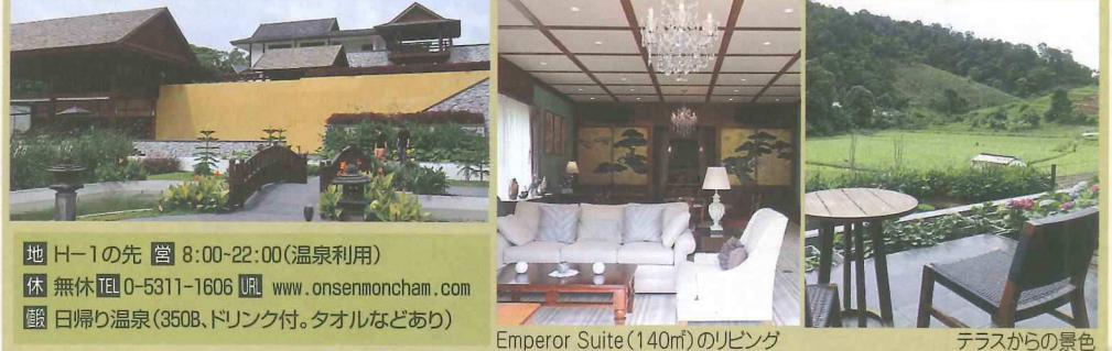
地 H-1の先 窓 8:00-22:00(温泉利用) 休 無休TEL 0-5311-1606 www.onsenmoncham.com 観 日帰り温泉(350B、ドリンク付。タオルなどあり) Emperor Suite (140㎡)のリビング テラスからの景色

メーサー・エレファントキャンプから北へ車で20分ぐらい行ったところにモンチェムという場所がある。タイ人に人気の観光地で、標高が高いこともあり、ブドウやイチゴ、山の景色を楽しむ人で特に冬は賑わっている。今年4月にオープンしたこのホテルも標高1200mに位置し、冬は10℃を下回るところに立っている。