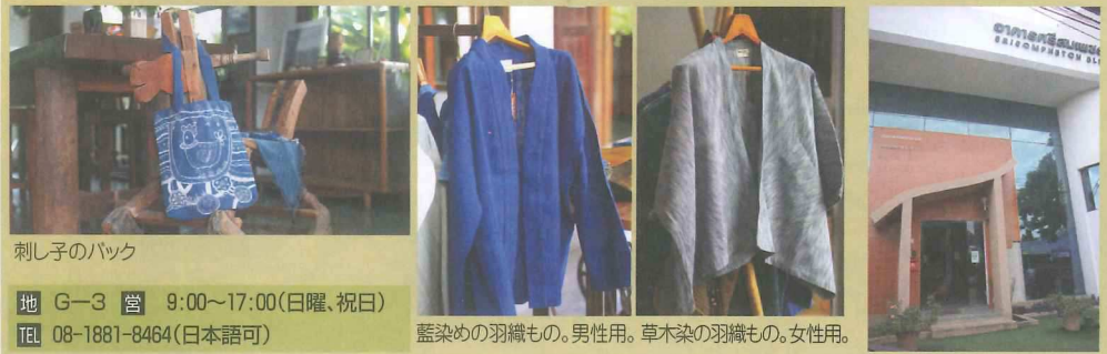
刺し子のバック 藍染めの羽織もの。男性用。草木染の羽織もの。女性用。

チェンマイは工芸が盛んな土地だが、産地はたいてい郊外に集中しているので、街中では製作風景を目にする機会は少ない。旧市街のお堀の北東の角からほど近い「ランナークラフト協会 (LCCA)」では、チェンマイを中心に北タイの工芸を日本に紹介する場所として、ランナークラフトギャラリー「むらまちまち」をオープンさせるというので、一足先にのぞいてみることにした。