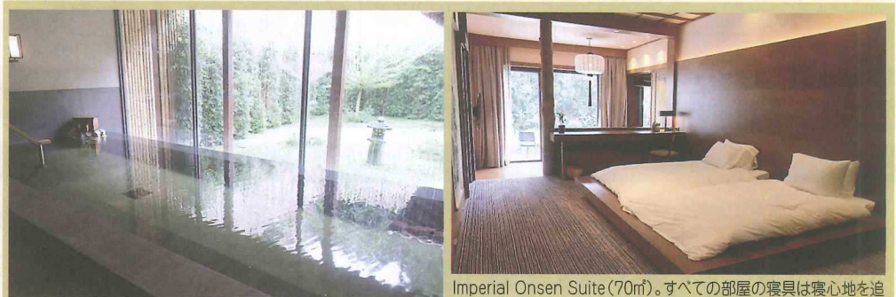
広々とした浴槽。温度は約39℃ Imperial Onsen Suite (70㎡)。すべての部屋の寝具は寝心地を追求した英国スランバーランド製。